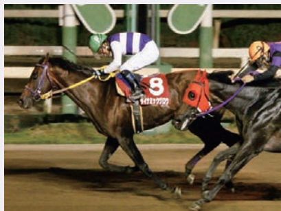
8月14日 摂津盃 ダイナミックグロウ