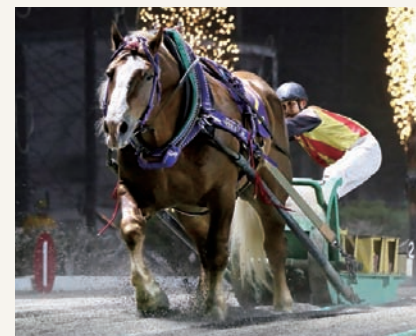
8月15日 ばんえいグランプリ フジダイビクトリー

その逆に、牝馬が隣りに入らないで欲しいと願っている関係者もいる。牝馬が近くにいと、入れ込みが激しく、レースにならないほど能力が減退してしまうからである。そのため、パドックでは牝馬から1頭だけ離れて歩く馬や、牝馬側に大きなプリンカーを装着され、関係を