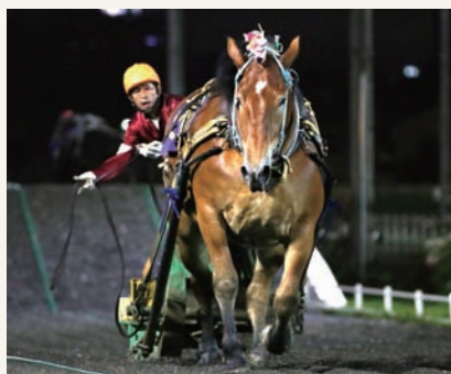
7月26日 ばんえい大賞典 シリウス

フジダイビクトリーの障害での強さを見て、ばんえい競馬は障害力がすべてだと、改めて感じさせられた一戦であった。その障害力をつけるためには、厩舎