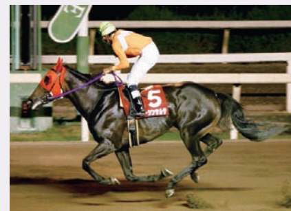
7月24日 兵庫サマークイーン賞 エーシンサルサ

8月18日の佐賀・サマーチャンピオンJpnⅢではタガノジンガロが2つ目のダートグレードタイトルを目指した。結