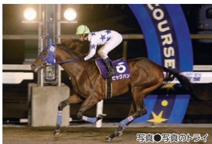
写真●写真のトライ