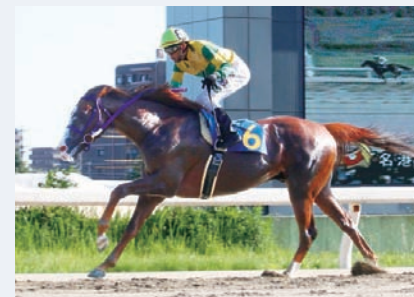
7月20日 名港盃 アップアンカー

また、夏のトピックは7月21日から開催を休止して、約1カ月間かけた馬場の全面改修工事。雨がやんでもなかなか回復せず「泥んこ馬場」と不評だったコースの砂をすべて取り除き、笠松競馬で