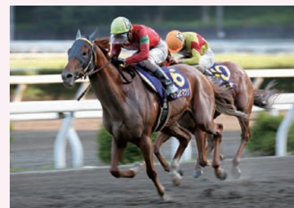
6月28日 高知優駿 オトコノヒマツリ

今年から高知競馬でも2歳新馬戦がスタート。1着賞金50万円という破格の賞金が用意され、フレッシュな若駒によるレースが行われた。8月末までで計3レースあり、制したのはニヨドスカイ、ディアマルコ、ハチキンの各馬。そのなかで、最も大物感に溢れているのがディ