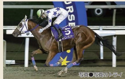
黄金配合の牝馬が栄冠賞を制覇