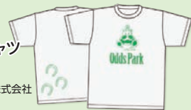
提供：オッズ・パーク株式会社

ご希望の方は官製はがきに、①ご希望のプレゼント名、②住所・氏名、③年齢、④「サイヤールンキング」、「重賞勝ち馬の血統を読む」についてのご意見・感想、⑤Odds Parkをご利用のご感想、⑥Odds Parkへのご意見・要望を明記の上、下記まで。締切は10月21日(水)の消印有効。当選者の発表は景品の発送をもって代えさせていただきます。なお、個人情報については景品の発送以外の目的では使用いたしません。 〒171-0022 東京都豊島区南池袋 2-47-4-503 有限会社サイツ OPC編集部 プレゼント係