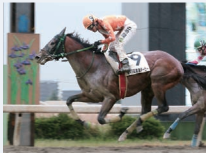
6月5日 東海ダービー バズーカ

名古屋競馬夏のハイライトはもちろん、3歳ナンバ1決定戦の東海ダービー。トライアル駿蹄賞を圧勝したハナノパレードが圧倒の人気で主導権を握ったが、大失速してまさかのシングル負け。変わって強さを見せつけたのは中団から鋭く抜け出した3番人気バズーカだった。文字通り、破壊力満点の「バズーカ砲」のサク裂で、世代頂点へ一気に上り詰めた。前走後に兵庫・園田から転入し、3週間余り。3走前の3月スプリングカップ(4着)の走りとは一変した。好位追走のミトノレオがハナノパレードを捕らえた最終3コーナーからだった。中団外