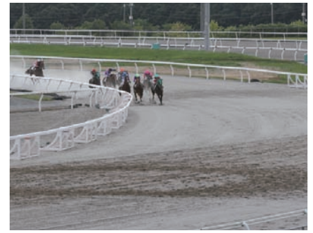
新設された内回りコースの4コーナー

単独開催になって6年。門別以外を知らない騎手も増えてきました。そういった意味で、内回りコースは騎手にとって刺激になるでしょうね。まだ使われ始めて間もないですから、旭川で好成绩を挙げていた騎手が有利になっているかもしれませんよ」