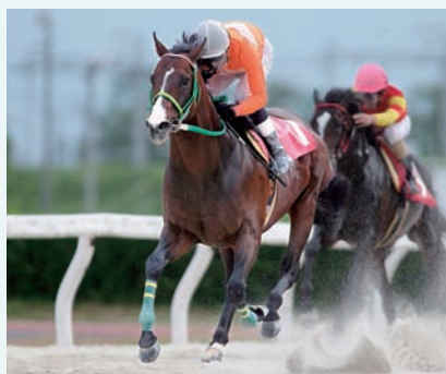
6月18日 サマーカップ タガノジンガロ

笠松競馬の夏シーズンは、力と格の違いでねじ伏せたサマーカップのタガノジンガロ（兵庫）が印象的だったが、くろゆり賞のアップアンカー（名古屋）の走りも光った。「東海の顔」へと急成長した姿を笠松ファンも認識したはずだ。初重賞挑戦の7月名港盃でタイトルホルダーの仲間入りした好素材が、笠松の地でも輝いた。アッと驚かせた初の逃げ切り劇で優勝した前走名港盃とは一転。今度は中団位置からロングスパートしてひとまくり。着差以上の派手な勝ちっぷりで重賞V2を成し遂げた。「去年勝ったタッ