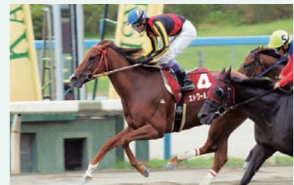
8月11日 読売レディス杯 エトワールドロゼ