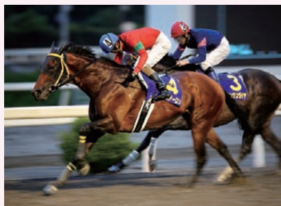
8月30日 建依別賞 エブソムアーロン

8月30日に行われた第38回建依別賞は、エブソムアーロンが勝利を飾った。この一戦まで、高知競馬内外を問わず重賞8勝。途中、約1年1カ月の長期休養がありながら、前々走ではトレノ賞を圧勝し、健在ぶりを示していた。ただ、今回の建依別賞は前走、佐賀のサマーチャンピオンJpnⅢ(8月18日)からのほぼ連闘。5着と善戦した後の一戦であり、その疲れだけが心配されたが、2番手追走から粘るマウンテンダイヤを3/4馬身振り切り、重賞9勝目を手にした。勝ちっぷりに以前ほどの迫力がなかったとの見方もあるが、1400メートル戦の走破