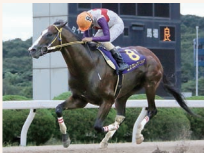
7月26日 吉野ヶ里記念 エスワンプリンス

を追走も、8着に敗退したが、佐賀勢4頭の最先着を確保した。佐賀の短距離路線へは昨年、一昨年は出走がなかったが、この舞台に出てくればやはり強さを発揮した。「よそへ行ったときの走り、佐賀での走りの釣りが取れない。佐賀ではあまり走らないのかな？」(手島勝利調教師)とのことで、秋の目標は今