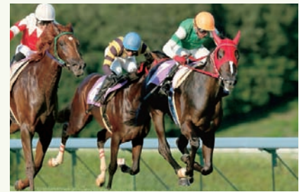
8月15日 若鮎賞 メジャーリーガー